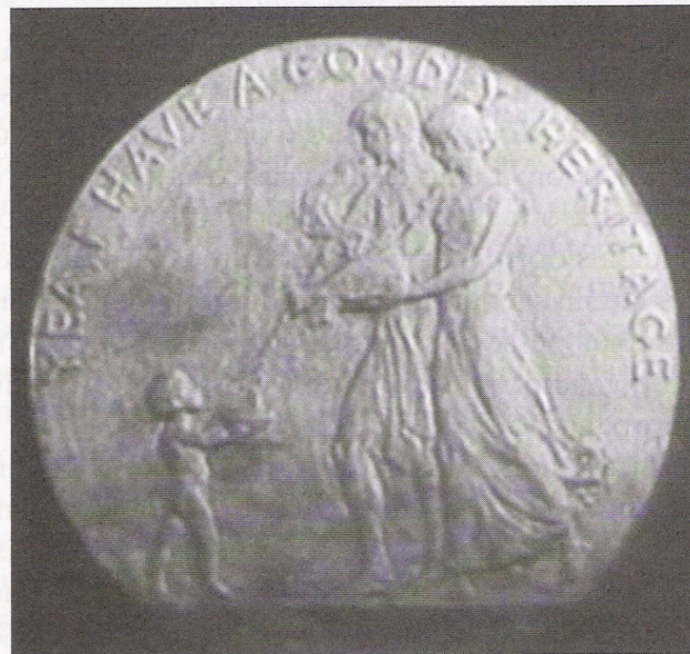
Na imagem, uma família norte-americana exemplar; inscrita e considerada eugenizada pelo concurso de "Fitter Families" recebeu a "medalha da boa herança" que trazia os dizeres: "Sim, eu tenho uma boa descendência!"